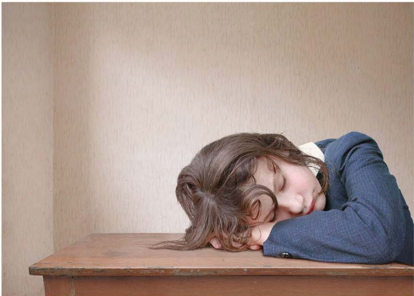
Yanan © Loretta Lux, VG Bild-Kunst, Bonn 2004, Courtesy Torch Gallery