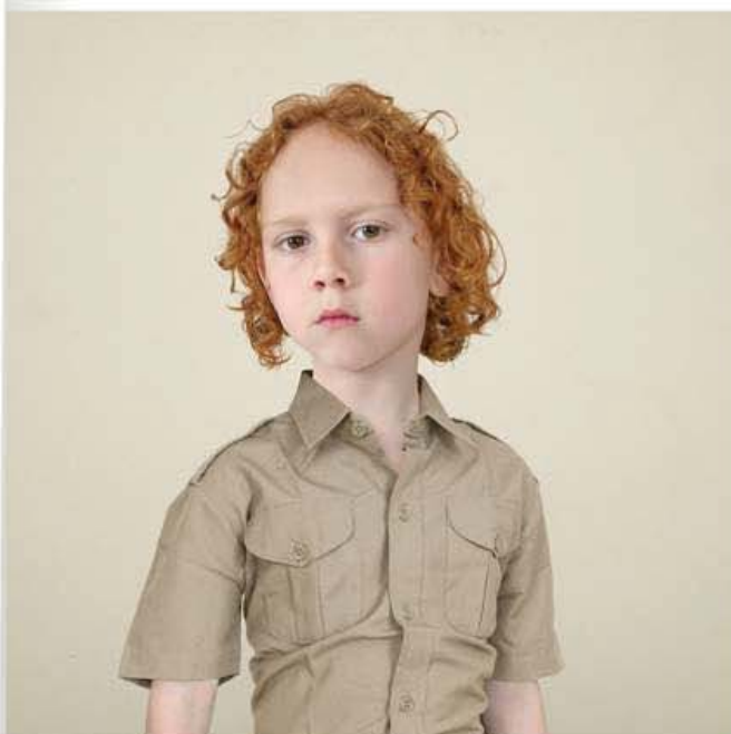
Milo © Loretta Lux, VG Bild-Kunst, Bonn 2004, Courtesy Torch Gallery

Loretta Lux spreekt zelf over 'forlornness' als thema van haar werk. Wat mij betreft is die eenzaamheid, die troosteloosheid van een verpletterende soort. Al haar kinderen lijken te moeten doen wat er van ze gevraagd wordt, al haar kinderen lijken eruit te zien zoals anderen zeggen dat ze eruit moeten zien, al haar kinderen lijken hun identiteit te moeten ontkennen of, sterker nog, te moeten inleveren. Er is geen enkele reden voor kinderlijke vrolijkheid. Op deze manier kind zijn moet vreselijk zijn. Ik kan er niet aan ontkomen deze thematiek mede in verband te brengen met de cultuur van het land waarin Lux opgroeide. Met name met de cultuur van vijftientwintig of meer jaar geleden, toen ze zelf de leeftijd van haar modellen had. Schoolkinderen die aan het begin van de les, staand naast hun leraar, de juf of de meester begroeten met een knik door de knieën, een knikje met het hoofd.